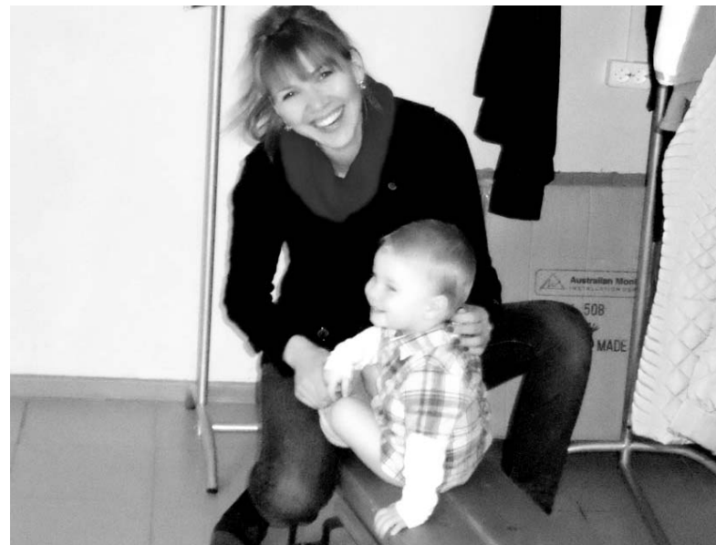
Юный посетитель ФОКа.